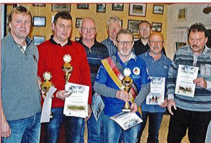
Die Meister 2015 der Weistreckenfreunde Harz. Diese Sportfreunde sind auch als Mitglieder im WSC-MDL organisiert.